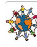
Blok 6 We zijn allemaal anders

In de klas is besproken wat de gevolgen zijn als ik me niet veilig, verantwoordelijk en respectvol gedraag.