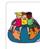
Blok 1 We horen bij elkaar