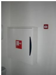
ontruimingshandmelder (meestal aanwezig bij brandslanghaspel)