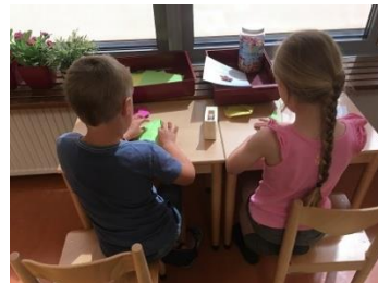
Samenwerking in beeld