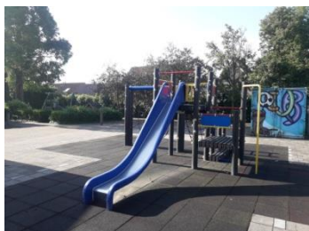
Speeltoestel op het schoolplein

Wel dient opgemerkt te worden, dat in de meeste gevallen ouders aansprakelijk blijven voor hun kinderen. Een gezinsverzekering voor wettelijke aansprakelijkheid zal in veel gevallen uitkomst bieden.