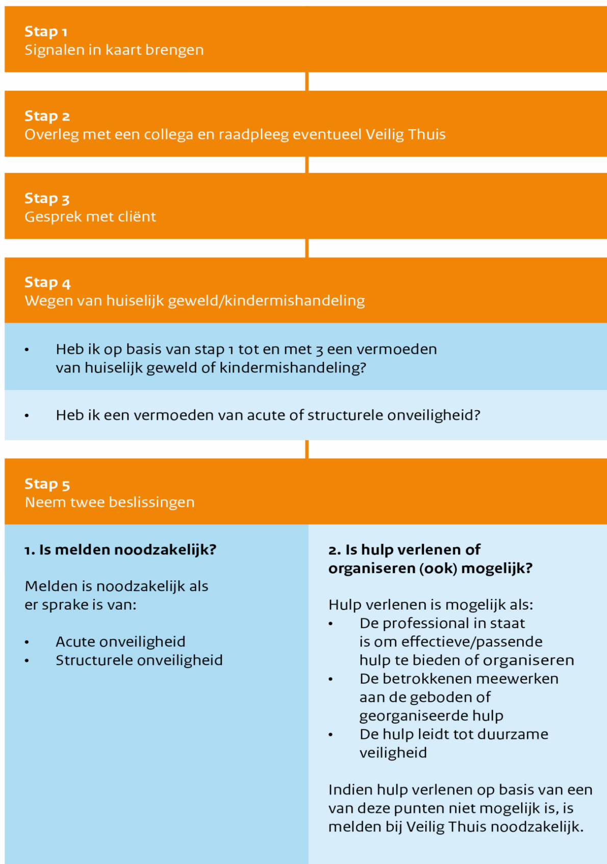
Figuur 1: Stappenplan verbeterde meldcode