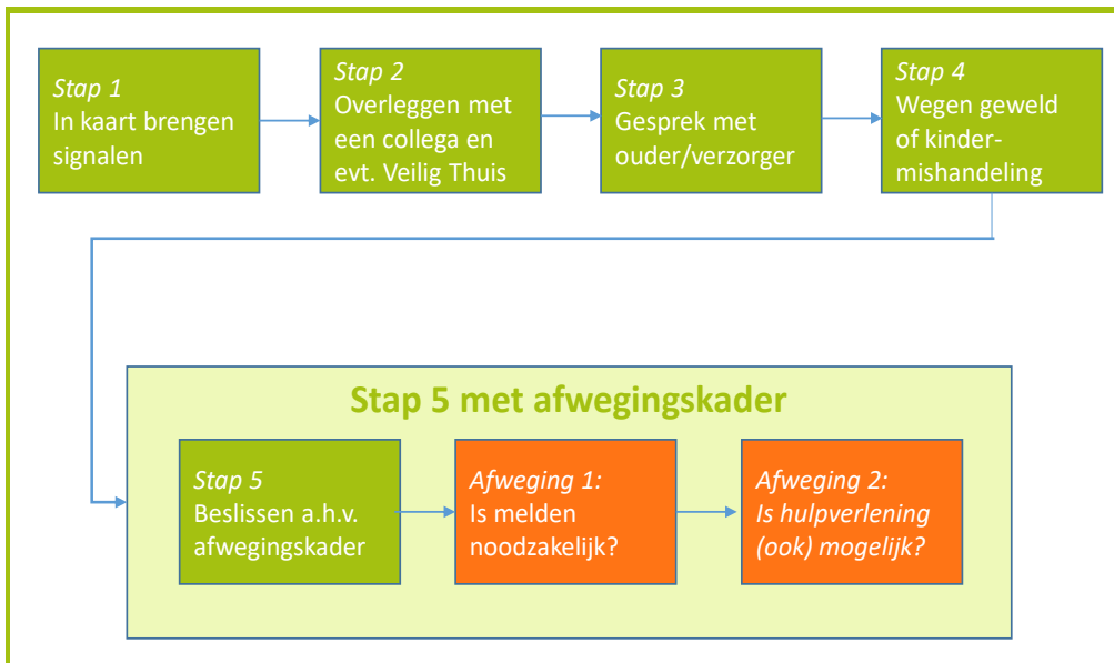
Tabel 1: Afwegingskader Meldcode huiselijk geweld en kindermishandeling