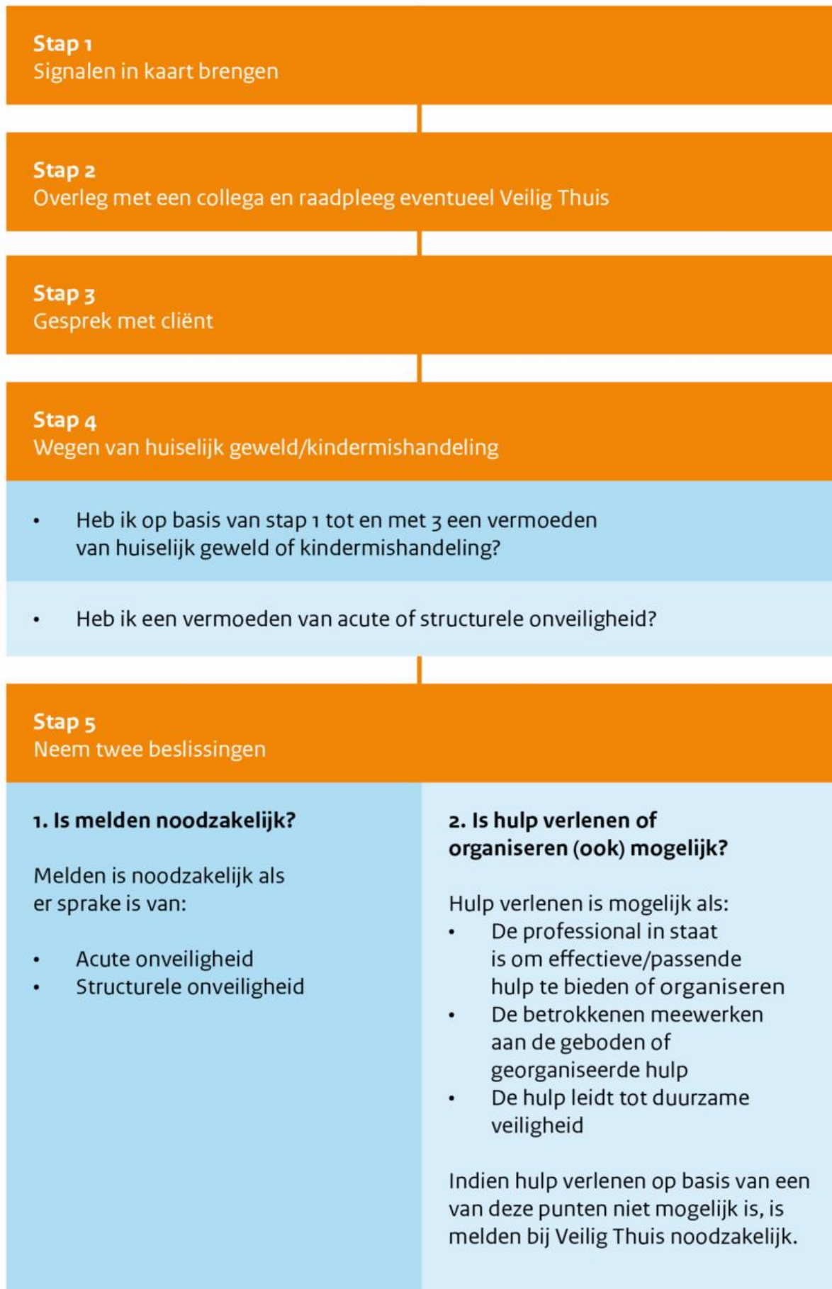
Figuur 1: Stappenplan verbeterde meldcode