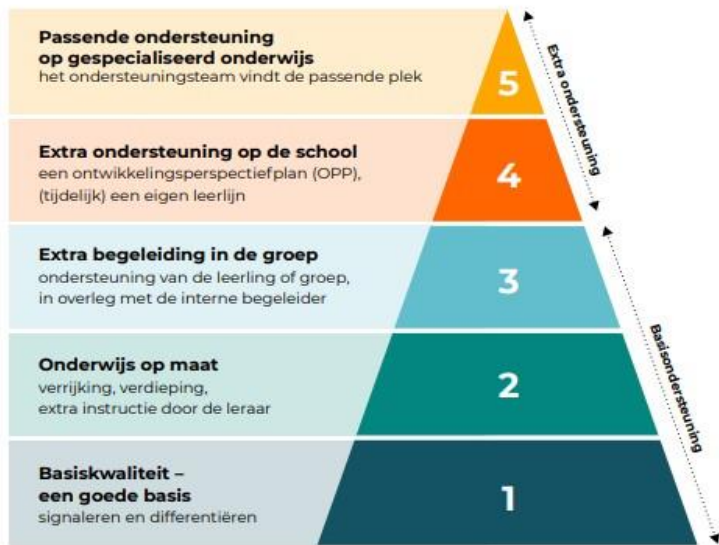
Pyramide handelingsgericht werken (HGW)

Wanneer meer nodig is organiseert de school in overleg met de ouders extra ondersteuning. Dit kan kortdurend maar ook structureel zijn. De afspraken hierover worden opgenomen in een plan, dit wordt een ontwikkelingsperspectief genoemd.