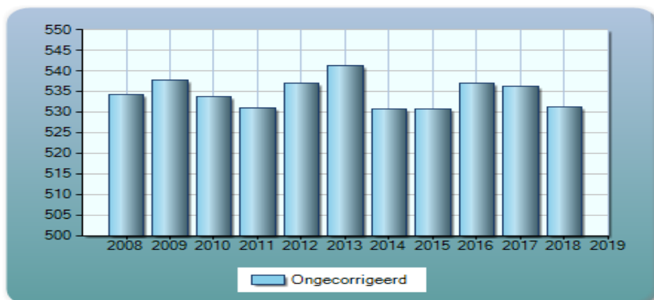
Tabel scores op de CITO eindtoets

In 2019 zijn wij overgestapt op de AMN-eindtoets. Hier is nog geen historisch overzicht van te plaatsen. Het resultaat in 2019 op de AMN-toets was een score van 399,9. Om deze score in enig perspectief te plaatsen: de ondergrens van de inspectie lag voor ons schooltype op een score van 381.