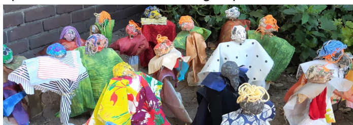
Kunst project: Vreemde Vogels

Onze muzieklessen en projectdagen Kunst en cultuur worden gegeven door vakdocenten. Zij ondersteunen ons bij vieringen, openingen, optredens en de musical voor groep 8.