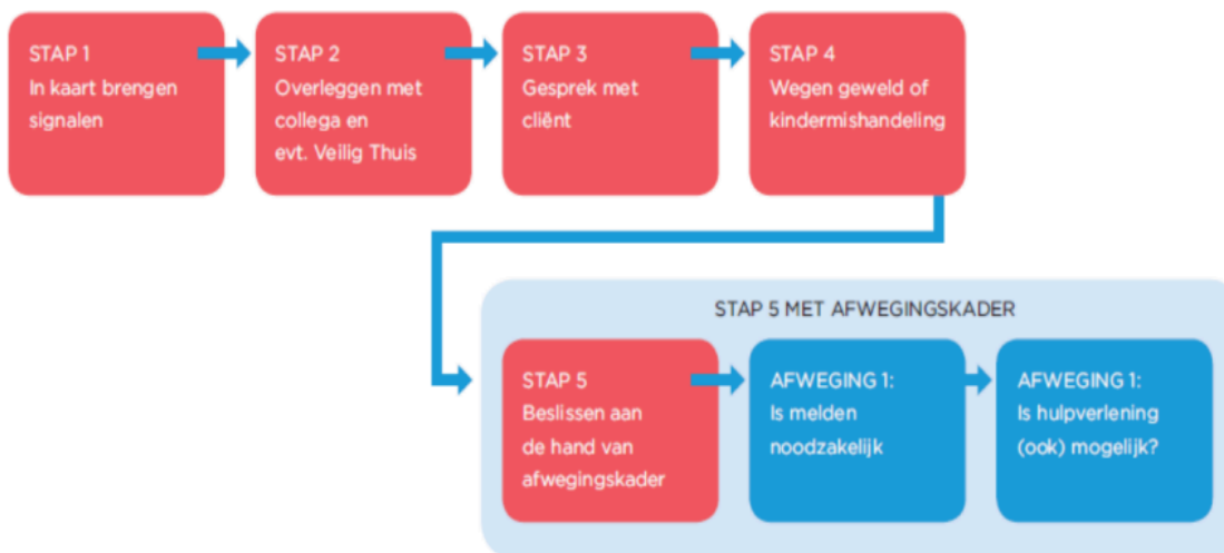
Figuur 2: Nieuwe situatie: Meldcode met afwegingskader