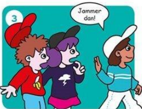
Ga iets anders doen.