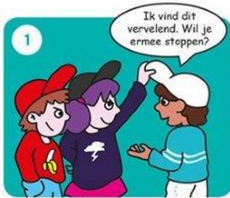
Zeg dat je het niet leuk vindt.