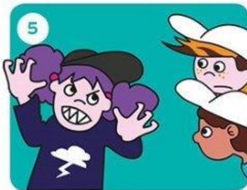
Gaat het door?