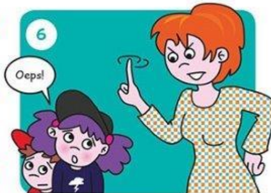
Ga naar je juf of meester. Die grijpt in.