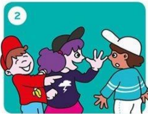
Gaat het door?