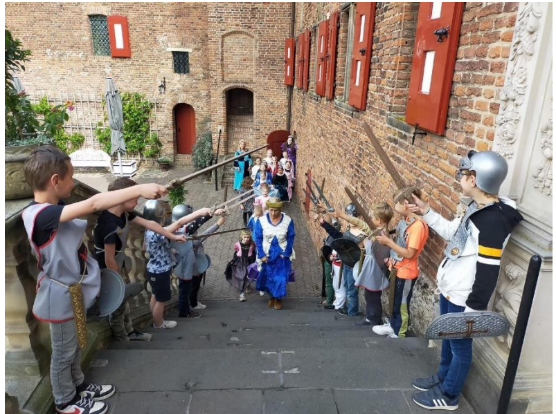
Thema ridders en kastelen bezoek aan kasteel huis Bergh