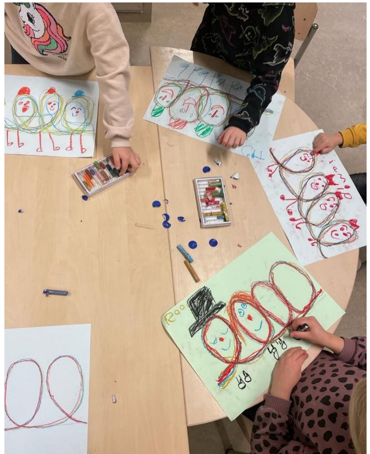
Motorische oefeningen Krullenbol: voorbereidend

Ben je na het gesprek zo enthousiast geworden dat jij je kind wilt aanmelden? Dat kan via het inschrijfformulier. Je krijgt deze mee, maar ook die vind je op onze website. schrijven