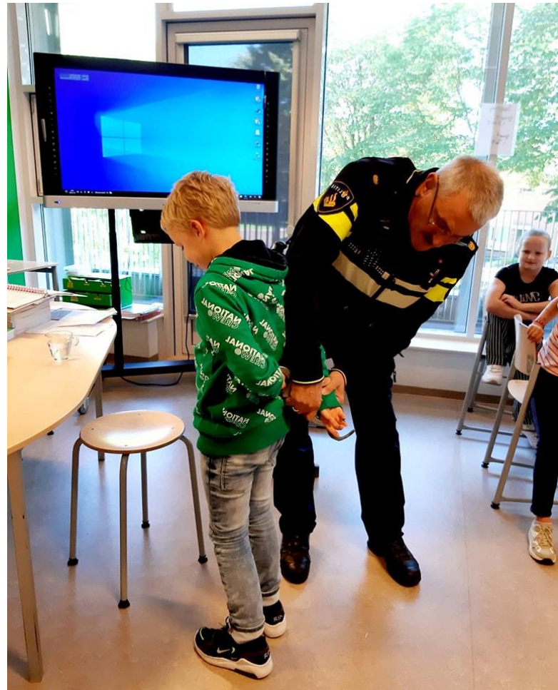
Thema staatsinrichting, de wijkagent op bezoek

We gaan altijd voor een goed pedagogisch klimaat. Dat betekent dat de sfeer goed is. Dat iedereen op een prettige manier met elkaar omgaat. De Piersonschool heeft dan ook het pedagogisch klimaat als een paraplu boven alle andere activiteiten hangen. Als school houden wij ons aan de afspraken die in het kader van veiligheid zijn vastgesteld door de Scholengroep GelderVeste.