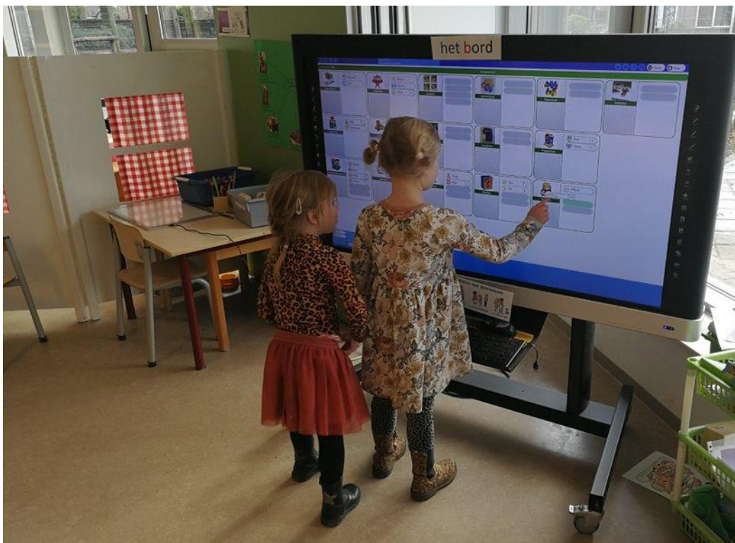
Speel- werktijd: kiezen op het digikeuzebord

Jouw kind krijgt twee keer per jaar zijn portfolio mee naar huis. Het maakt kinderen bewust van hun eigen rol in hun leerproces. Je ziet waar hij de afgelopen periode mee bezig is geweest. Ook zit er een verslag in van het portfoliogesprek dat de leerkracht met jouw kind heeft gehad. En je vindt zijn toets resultaten hier. Bij de midden- en bovenbouw vanuit Cito en bij de onderbouw vanuit de leerlijnen Digikeuzebord waarop we kinderen volgen.