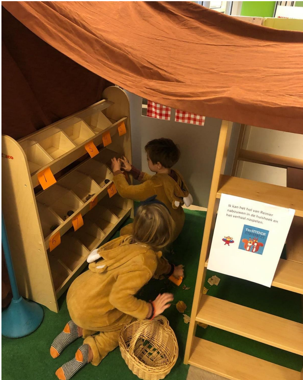
Speel-rekenhoek n.a.v. het prentenboek de Vechtende eekhoortjes