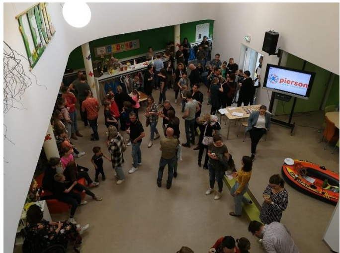
Ouder-kindavond 2022: Thema executieve functies trainen gezelschapspelletjes te spelen

Eén keer per jaar is er een algemene ouder- en kindavond. Als ouder en kind ben je van harte welkom. Jullie ontvangen informatie en kunnen lekker met elkaar aan de slag over een onderwerp. De MR/OR zijn medeorganisatoren.