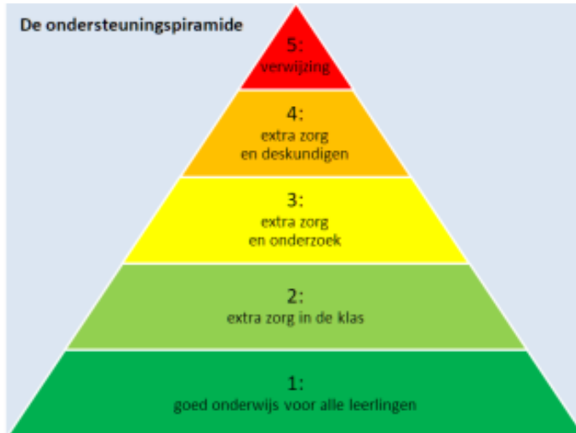
Vijf ondersteuningsniveaus, Nutsschool Wassenaar