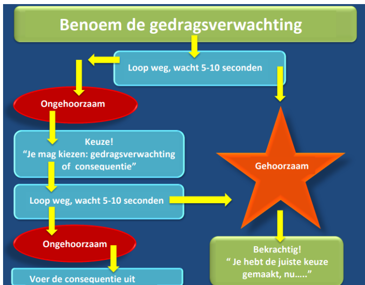
Afbeelding: de reactieprocedure uitgelegd in een schema