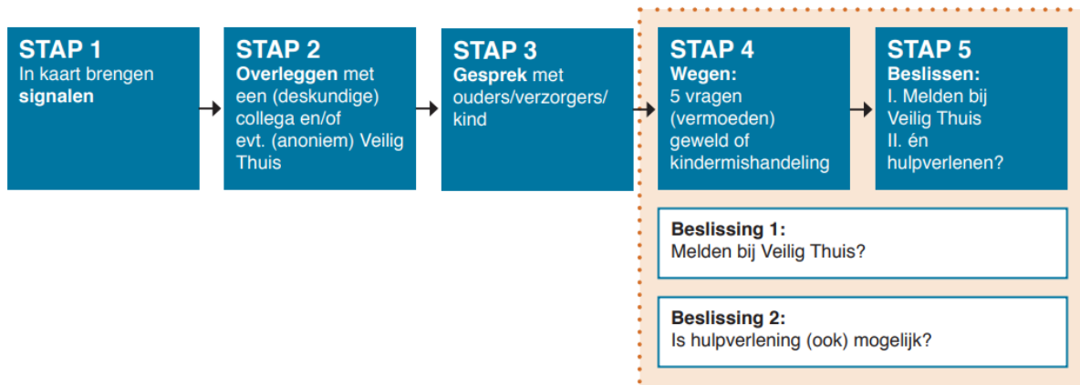
Figuur 1. Afwegingskader