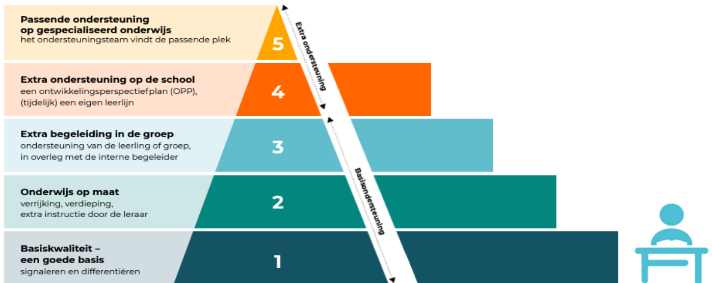
Piramide handelingsgericht werken (HGW)

De werkwijze heeft vijf niveaus van ondersteuning. Die wordt vaak met een piramide uitgebeeld. Hoe hoger het niveau, hoe meer ondersteuning en overleg er nodig is. De piramide ziet er zo uit: