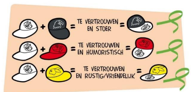
Figuur 2: De kanjerpetten.

Je kunt ook een kanjer zijn in combinatie met de rode pet. Dan ben je vol levenslust. Je hebt een goed gevoel voor humor. Je bent optimistisch en je verstaat de kunst van het relativeren. Zolang naast de rode pet ook de witte pet van het vertrouwen aanwezig is, zullen deze kinderen op een hele positieve en opgewekte manier weten te reageren.