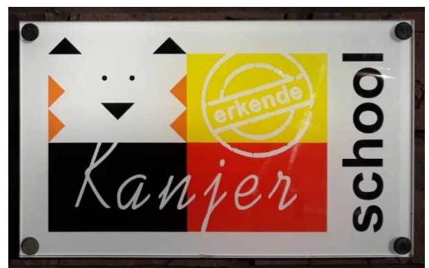
Figuur 1: Erkend Kanjerschool.

Het team is gecertificeerd voor het geven van kanjerlessen. De Kanjertraining is één van de door de overheid gecertificeerde programma's (Stichting Kanjertraining) om pesten tegen te gaan. De kanjertrainingen worden in alle groepen gegeven. We zorgen ervoor dat iedere week een kanjeractiviteit (les, spel, oefening) aan bod komt. Het is goed dat ouders ook iets meer weten over de achtergronden van de kanjertraining. Alleen zo is te begrijpen waar wij mee bezig zijn, en kunnen we elkaar aanvullen en ondersteunen.