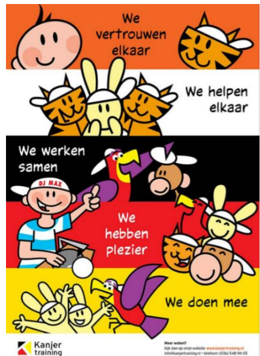
Figuur 4: De kanjerafspraken.

Graag verwijzen wij u voor meer informatie naar de website van de Stichting Kanjertraining: https://kanjertraining.nl/ .