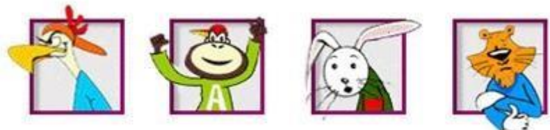
Figuur 3: Kanjertraining gedragstypen: De pestvogel (zwarte pet), de aap (rode pet), het konijn (gele pet), en de tijger (witte pet).

komt dan het woordje 'te' te staan. Kinderen reageren dan te krachtig, te stoer en smeden plannen die ten kosten gaan van anderen. De vrolijke kinderen reageren nu te lollig met humor dat ten koste gaan van een ander en/of zichzelf. Het gedrag is onvoorspelbaar onbetrouwbaar, niet serieus te nemen en beledigend. De vriendelijke en bescheiden kinderen reageren nu angstig en te lief. Deze kinderen cijferen zichzelf helemaal weg en worden als het ware onzichtbaar. De eerste mept van de weeromstuit van zich af, de tweede maakt er een grap van en de derde geef het op. Als het onderling vertrouwen wegvalt in een groep, dan is de kans groot dat verschillende kinderen zich depressief ontwikkelen.