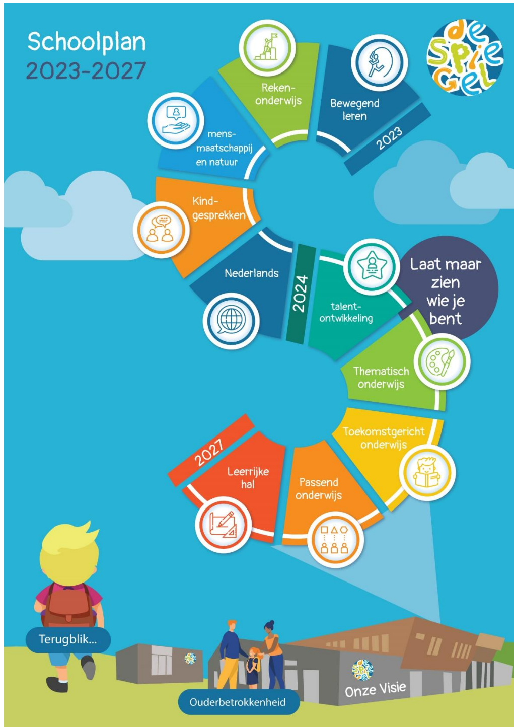
Figuur 5: Schoolplan 2023-2027.

Het schoolplan met bijlagen staat ter inzage op de website van de school, en kunt u hier vinden. We hebben ons schoolplan in het volgende beeld vormgegeven: