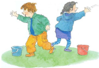
Samen houden we de klas en het schoolplein netjes schoon