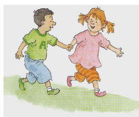
Help elkaar een handje