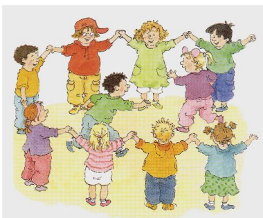
Iedereen hoort erbij