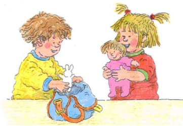
Eerst vragen, dan pas lenen