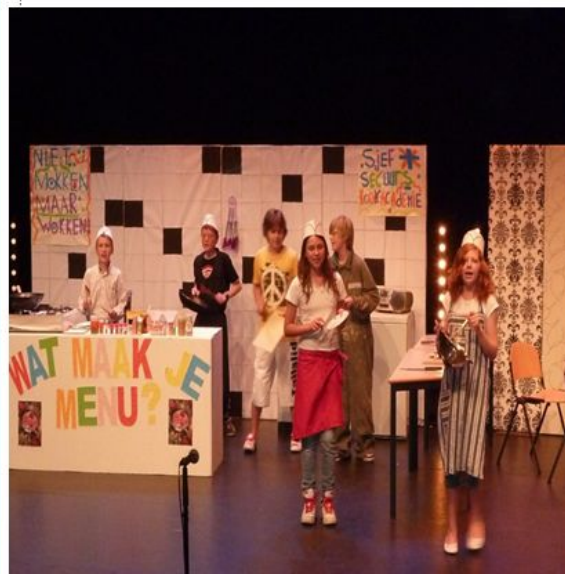
Fase 5 Termination: fase van afscheid nemen van elkaar