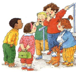
Erover praten is geen klikken