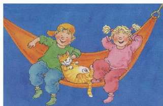
Zorg goed voor elkaar