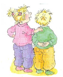
Geef elkaar complimentjes