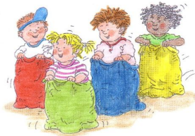
Samen spelen is gezellig