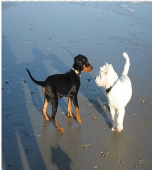
Fase 1: Forming; oriëntatiefase