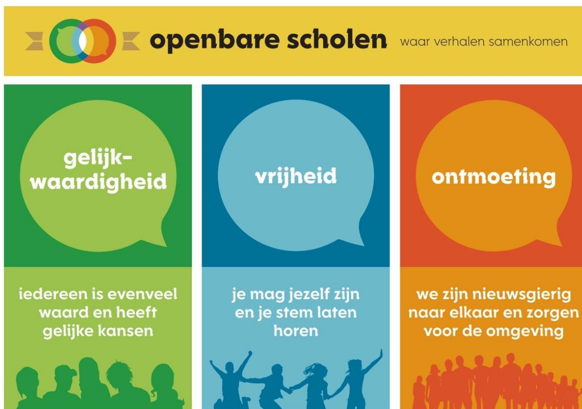
Figuur 1. Kernwaarden openbaar onderwijs

De openbare school is dé ontmoetingsplaats bij uitstek, de plek waar je nieuwe verhalen leert kennen en jouw eigen verhaal verder ontwikkelt, in relatie met anderen. Vanuit gelijkwaardigheid en vanuit vrijheid, ontmoet je de ander en ontmoet je mensen met verhalen vanuit de hele wereld.