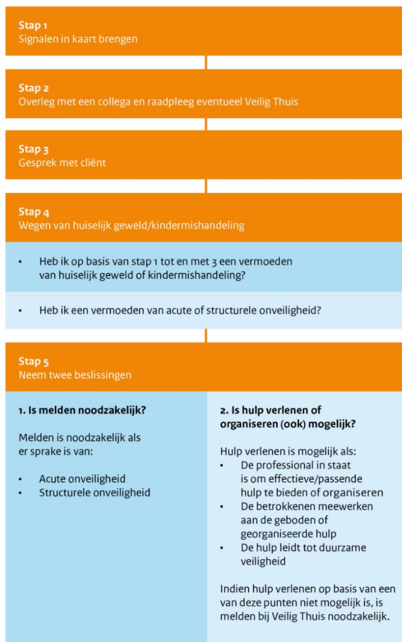
Figuur 1: Stappenplan verbeterde meldcode

Hoewel wij als school ons vooral richten op de veiligheid op school, zijn wij ook verplicht om onveilige thuissituaties te melden. Per 1 januari 2019 is de meldcode kindermishandeling en huiselijk geweld aangepast. Het is de norm om melding te doen bij Veilig Thuis als er vermoedens zijn van acute en structurele onveiligheid. Iedere medewerker die vermoedens heeft van kindermishandeling en huiselijk geweld moet de stappen (volgens de wet: Het afwegingskader in de meldcode | Nederlands Jeugdinstituut (nji.nl) ) en in overleg met het zorgteam, doorlopen.