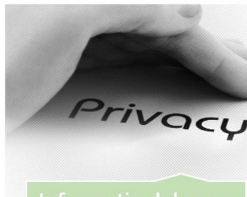
Informatie delen en privacy

Thema "Als er iets speelt, laat het de kinderen zijn"