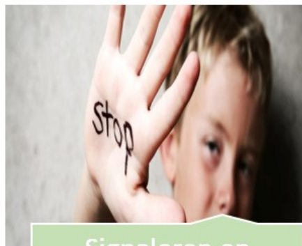
Signaleren en handelen