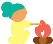
Spelen op gevaarlijke plekken