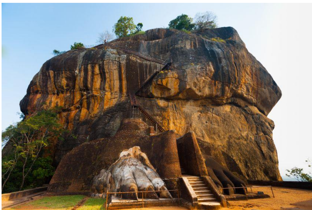
Leeuwenrots, Sri Lanka

Projectplan naar een rotsvast beleid pedagogisch klimaat in de brede zin voor Archipelschool De Leeuwenburch