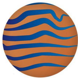
Rots & Water