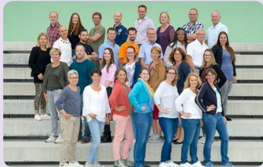
Havo 1e fase