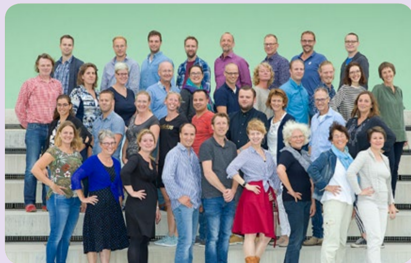
Havo 2e fase