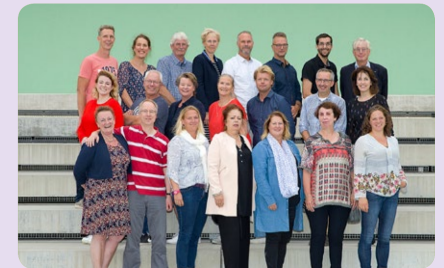
Atheneum 5 & 6