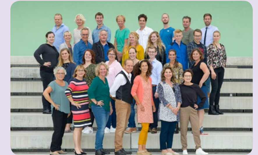
Atheneum 1 t/m 4