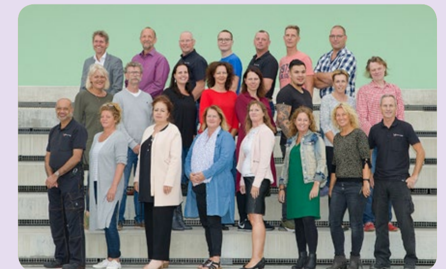
Schoolleiding en ondersteuning