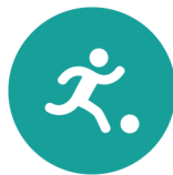
Spel en beweging / bewegingsonderwijs