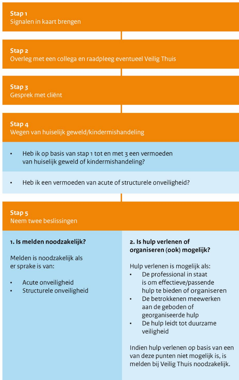
Figuur 1: Stappenplan verbeterde meldcode

De stappen van het afwegingskader vertaalt naar de Nobelaer: