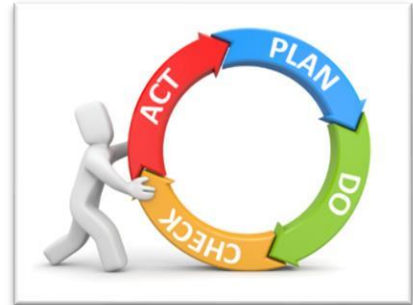
Planning en control-cyclus

Wij streven hoge opbrengsten na. Deze worden na iedere toets periode (twee keer per jaar) vastgesteld. Door middel van analyse van toetsen en het daaraan koppelen van interventies (zie 2.4) werken we opbrengstgericht. Dit gebeurt op leerling niveau, groepsniveau en schoolniveau. Leerkrachten bespreken regelmatig de opbrengsten van hun groep met de directie en de intern begeleider van school. Zo ontdekken we waar winst te behalen is en borgen we wat goed gaat. Alle leerlingen van groep 8 maken de CITO-eindtoets. Deze toets wordt PCBO-breed afgenomen en brengt de vaardigheden van de leerlingen op taal- en rekengebied in kaart. Meer informatie hierover vindt u in hoofdstuk 5.3: Eindopbrengsten en uitstroom.