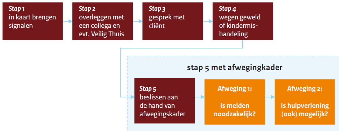
Vijf stappen van de meldcode

De scholen binnen Openbaar Onderwijs Groningen maken gebruik van de Meldcode Huiselijk geweld en kindermishandeling. Deze meldcode bevat een stappenplan wat binnen de school gehanteerd wordt bij vermoedens van huiselijk geweld en mishandeling. Dit 5-stappenplan is de basis voor de eigen meldcode. De aanscherping van 2019 is hierin meegenomen. Het gaat hier om de volgende vijf stappen: