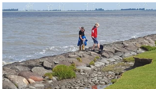
excursie Termunten “Punt van Reide”