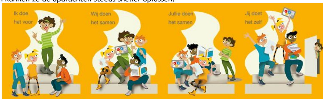
Figuur 1 . Rekenmethode Getal & Ruimte jr.

Tijdens de rekenlessen staat bij ons iedere week één nieuw leerdoel centraal voor de kinderen. De gehele week wordt er met de kinderen gewerkt om dat leerdoel te bereiken. Het verwerven van nieuwe rekenkennis verloopt volgens een aantal fases. De leerkracht geeft instructie aan de kinderen om hen op die manier kennis te laten maken met nieuwe lesstof. Gedurende de week oefenen de kinderen steeds zelfstandiger, maken ze minder fouten en kunnen ze de opdrachten steeds sneller oplossen.