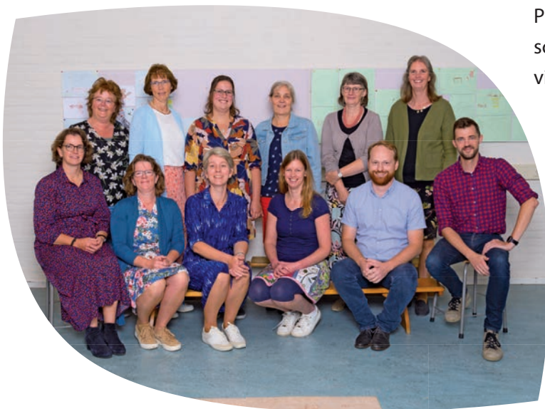
Personeel School met de Bijbel

Praktische informatie zoals contactgegevens, schoolvakanties, belschema's en externe contacten vindt u in onze schoolgids 'Deel A', de kalender.